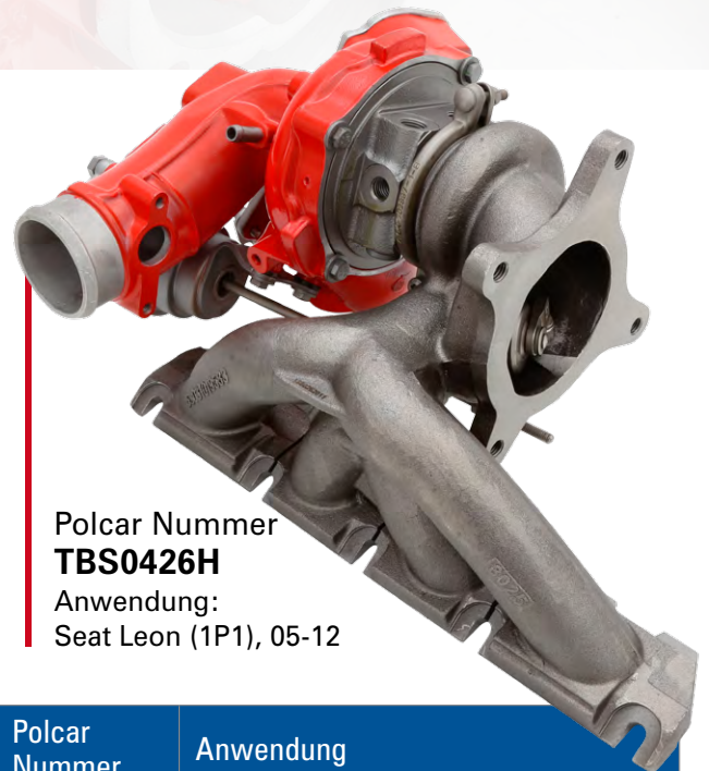
Polcar Nummer TBS0426H Anwendung: Seat Leon (1P1), 05-12