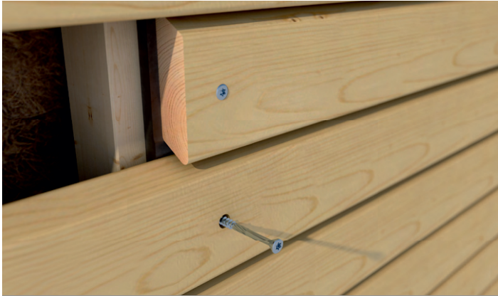
Anwendungsbeispiel der Hobotec.